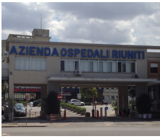
Il presidio di Viale Pinto